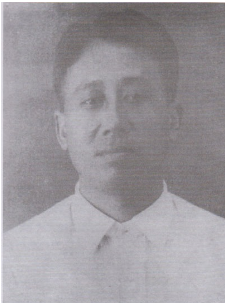
စစ်ကြိုခေတ် ဒို့ဗဟအစည်းအရုံး ခေါင်းဆောင်နှင့် ရဲဘော် သုံးကျိပ်ဝင် သခင်ထွန်းအုပ်