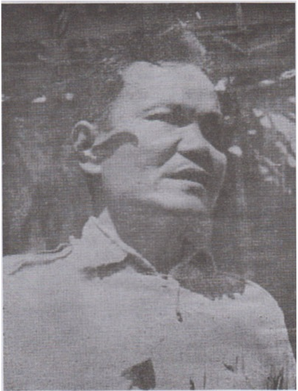
ဗမာပြည်ကွန်မြူနစ်ပါတီ၏ ခေါင်းဆောင်တစ်ဦးဖြစ်သူ သခင်သန်းထွန်း