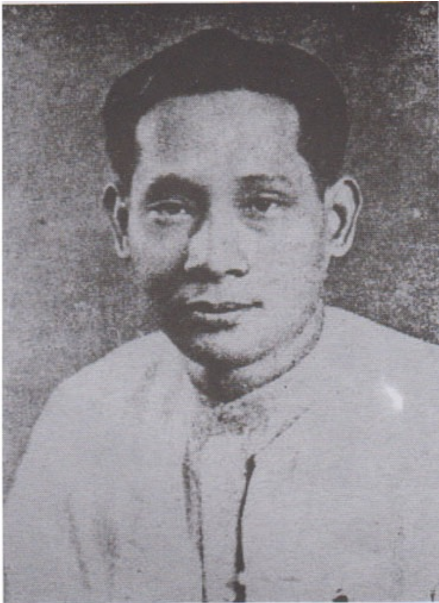
ကျောင်းသားသမဂ္ဂခေါင်းဆောင်၊ ဖက်ဆစ်တော်လှန်ရေး ခေါင်းဆောင်၊ ဆိုရှယ်လစ်ပါတီထူထောင်သူနှင့် ဖဆပလဝန်ကြီး ဦးဗဆွေ (ထားဝယ်)