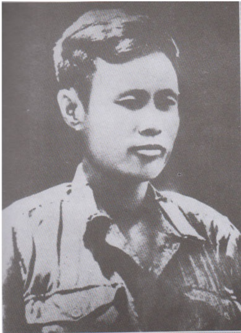
အမျိုးသားခေါင်းဆောင်ကြီး ဗိုလ်ချုပ်အောင်ဆန်း