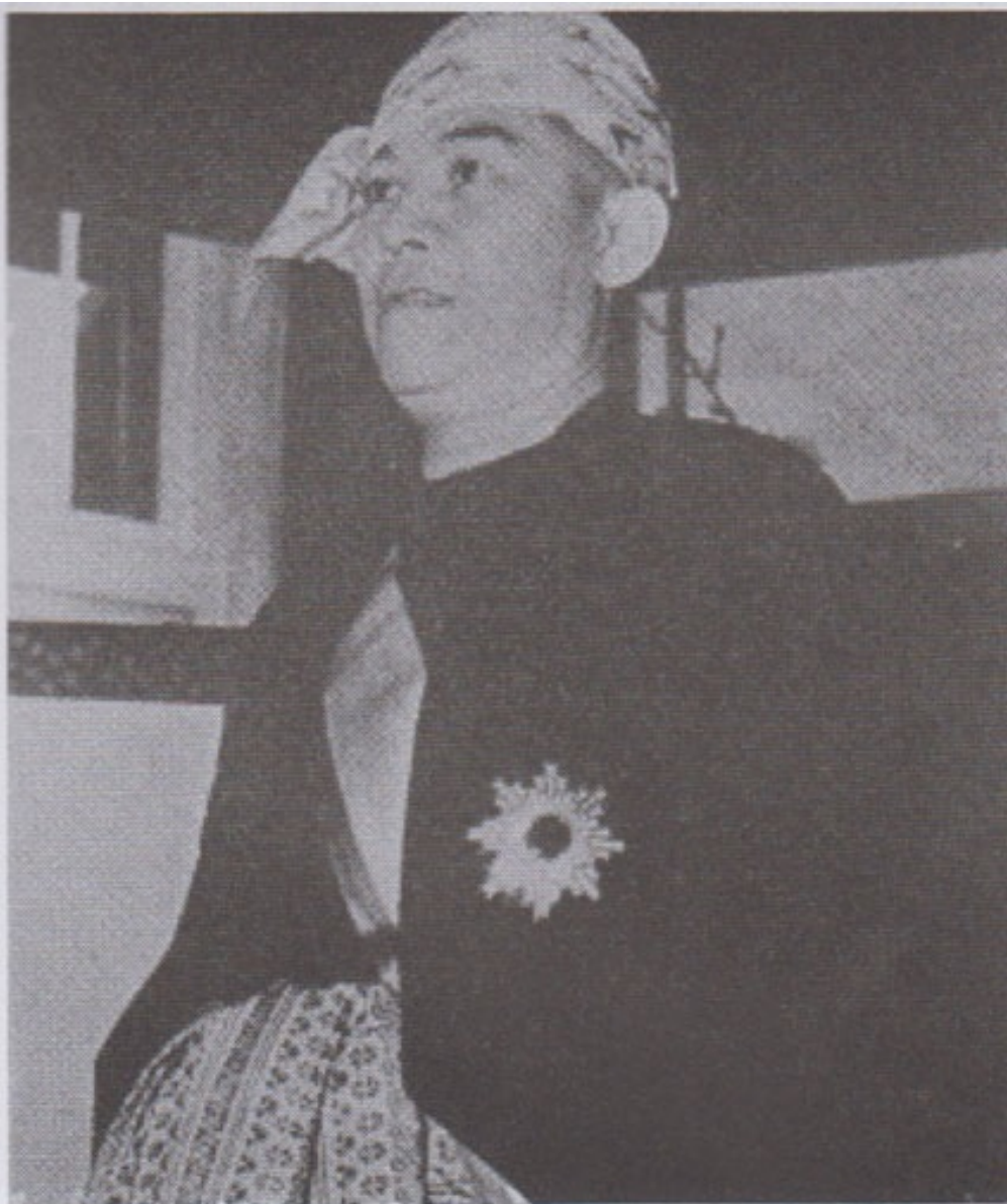
ဂျပန်ခေတ် မြန်မာနိုင်ငံတော် အကြီးအကဲ အဓိပတိ ဒေါက်တာဘမော်