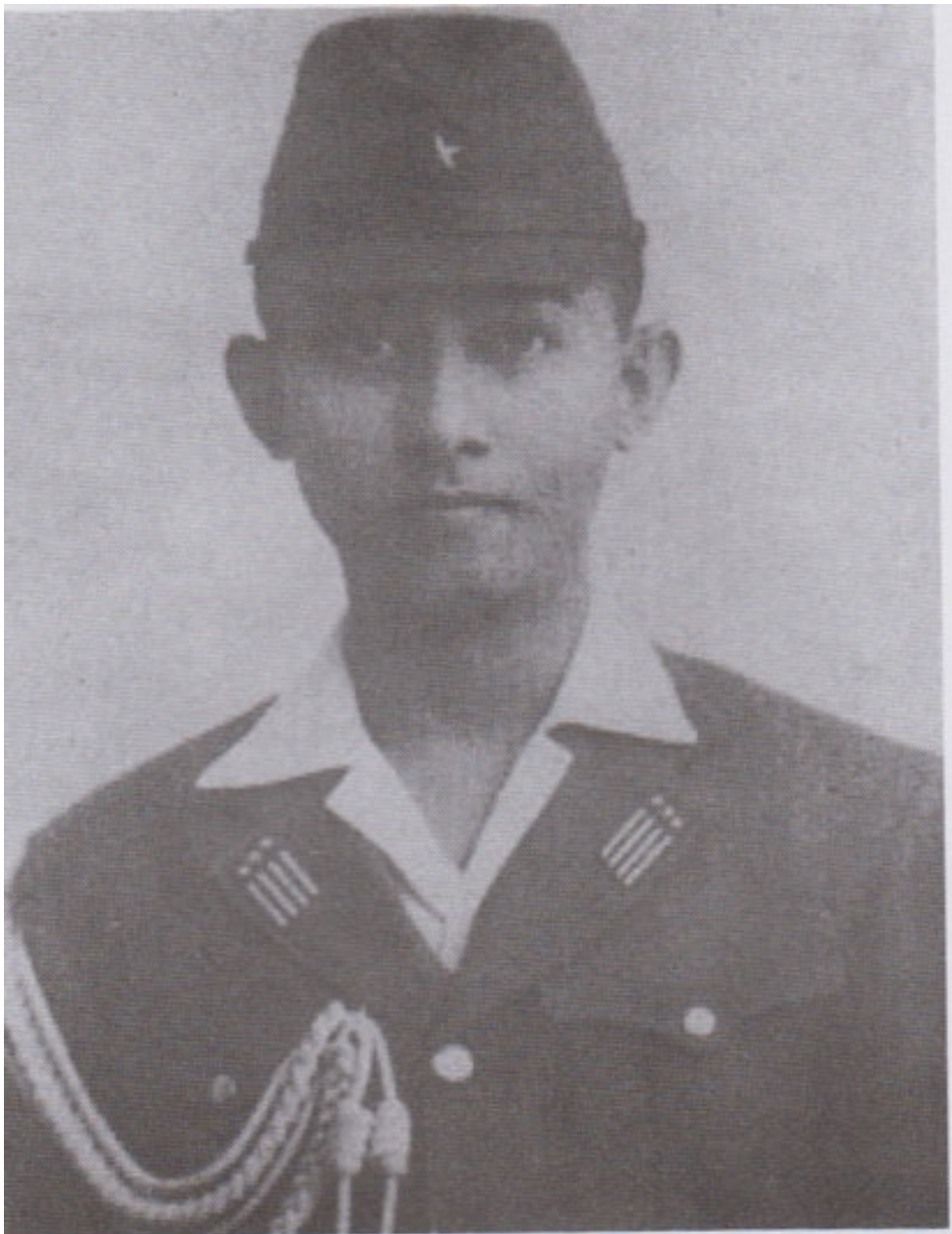
ရဲဘော်သုံးကျိပ်ဝင် BIA , BDA တပ်မတော်ခေါင်းဆောင် တစ်ဦးဖြစ်သူ ဗိုလ်စကြာ