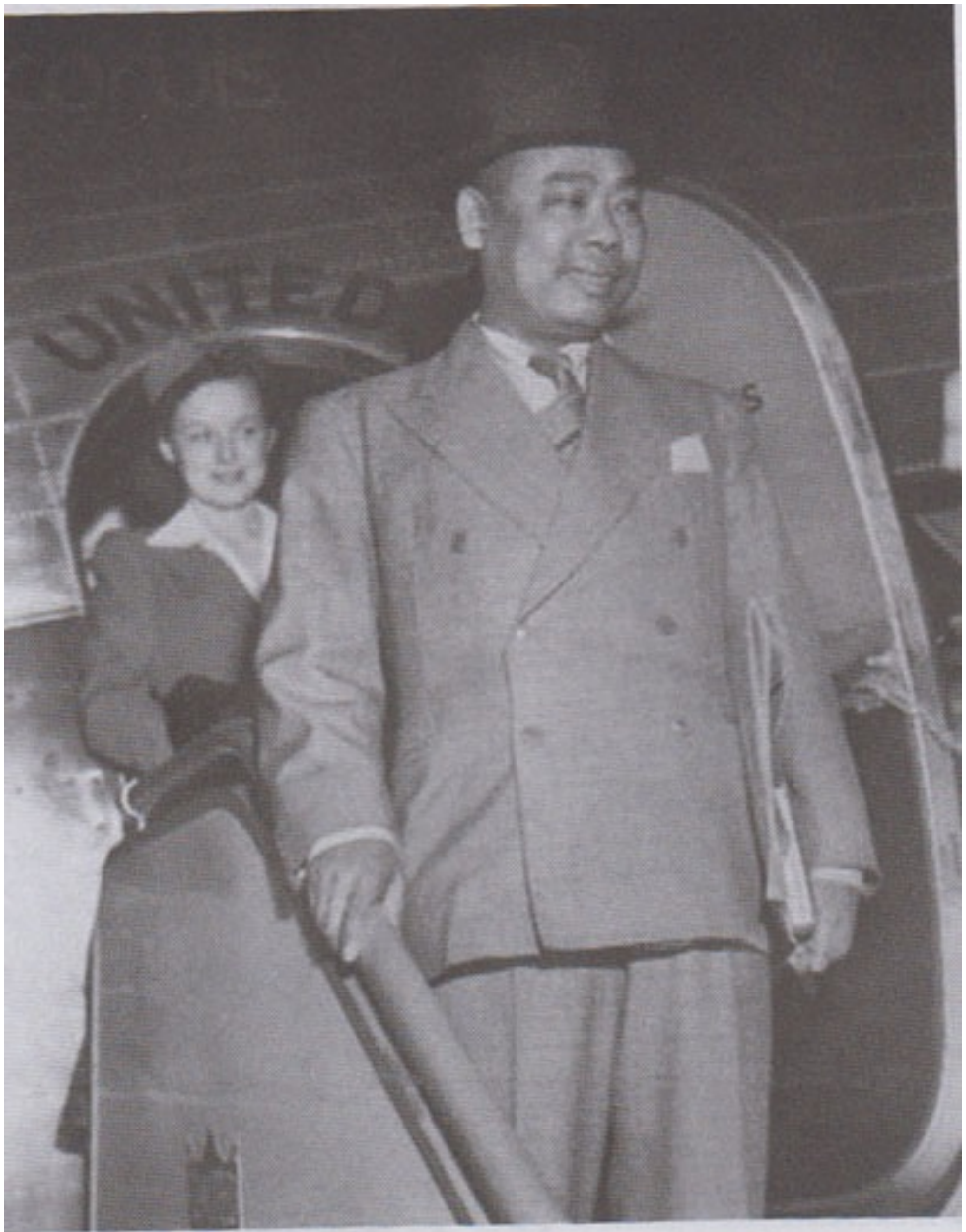
မြန်မာနိုင်ငံတော် နန်းရင်းဝန်ဟောင်းနှင့် ဗိုလ်ချုပ်အောင်ဆန်းကို လုပ်ကြံသူ ဂဠုန်ဦးစော