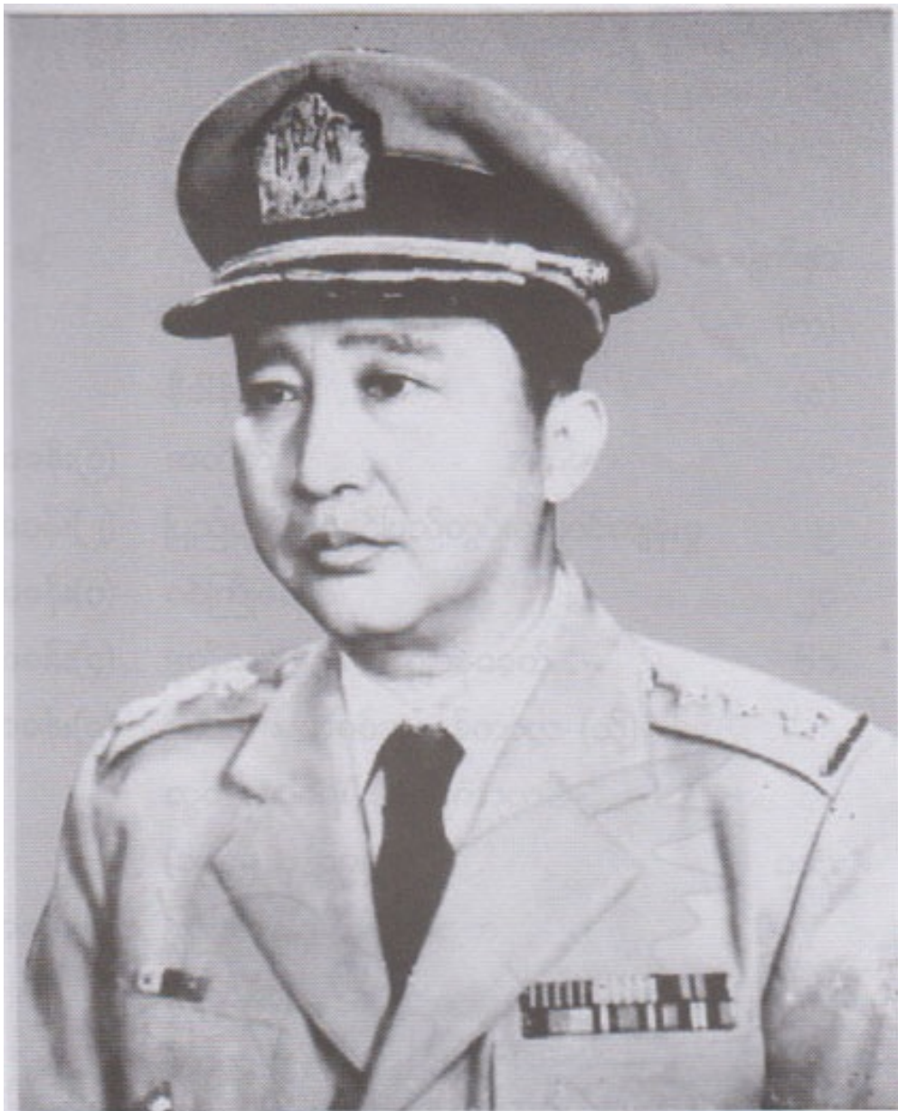
BDA နှင့် မြန်မာ့တပ်မတော်ပထမဆုံးတပ်မမှူး၊ တိုင်းမှူးနှင့် စာရေးသူ ဗိုလ်မှူးချုပ်တင့်ဆွေ (တင့်ဆွေ-ဖျာပုံ)