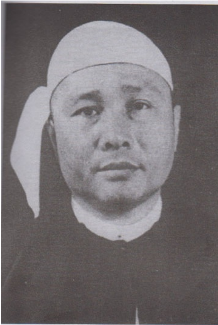
၁၉၄၈ ခုနှစ် မှ ၁၉၆၂ ခုနှစ်ထိ မြန်မာနိုင်ငံကို အုပ်ချုပ်ခဲ့သူ အစိုးရအဖွဲ့ခေါင်းဆောင် ဝန်ကြီးချုပ် ဦးနု