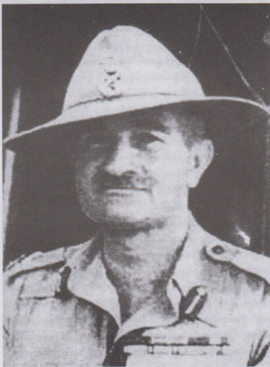
မြန်မာနိုင်ငံကို ဦးဆောင်ပြီး ပြန်လည်သိမ်းပိုက်ခဲ့သူ မဟာမိတ်တပ်မှူးကြီး ဖိလ်းမာရှယ်ဆာဝီလျံစလင်း