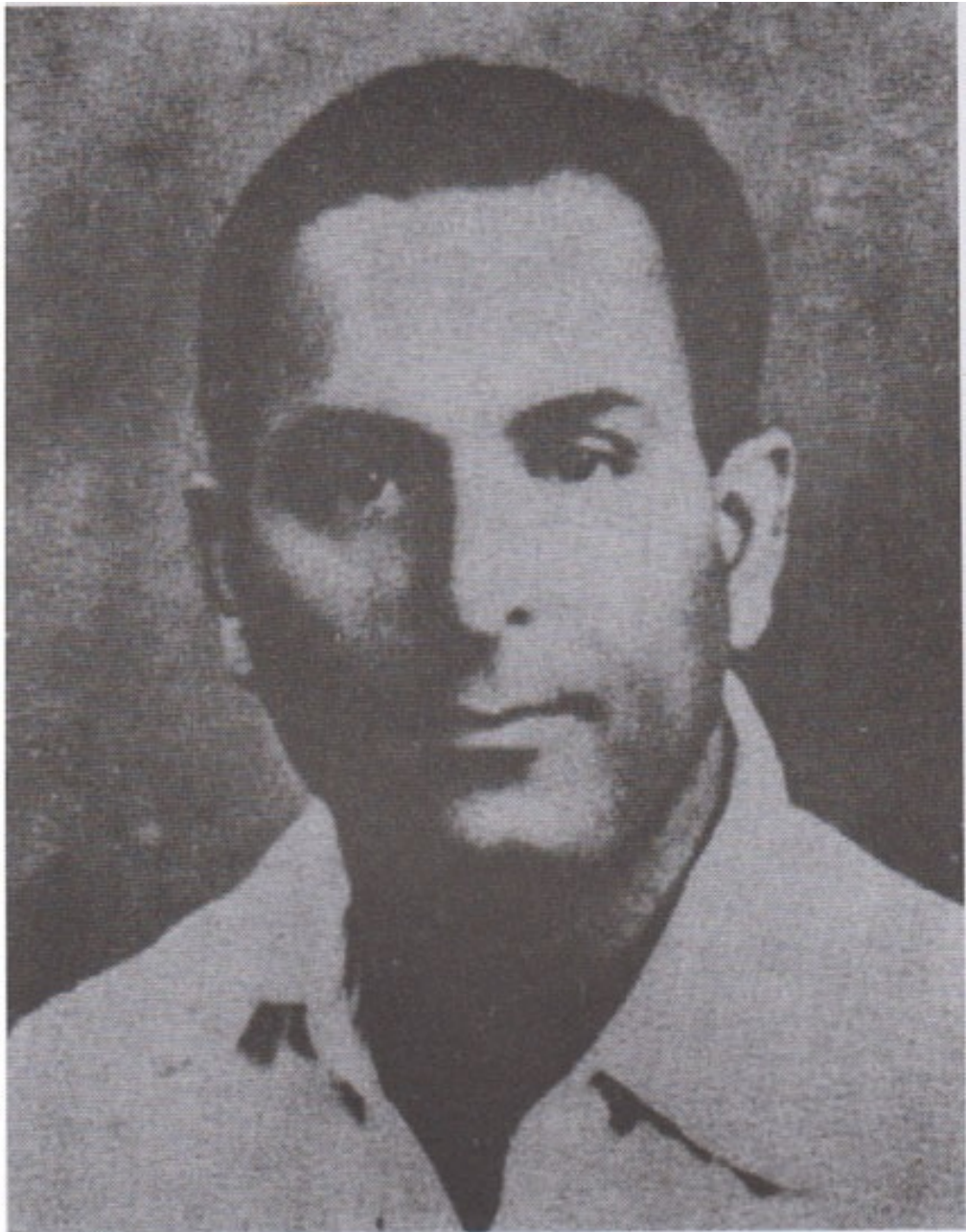
ဗမာပြည်ကွန်မြူနစ်ပါတီ ပေါ်လစီဗျူရီအဖွဲ့ဝင် ဂိုရှယ်