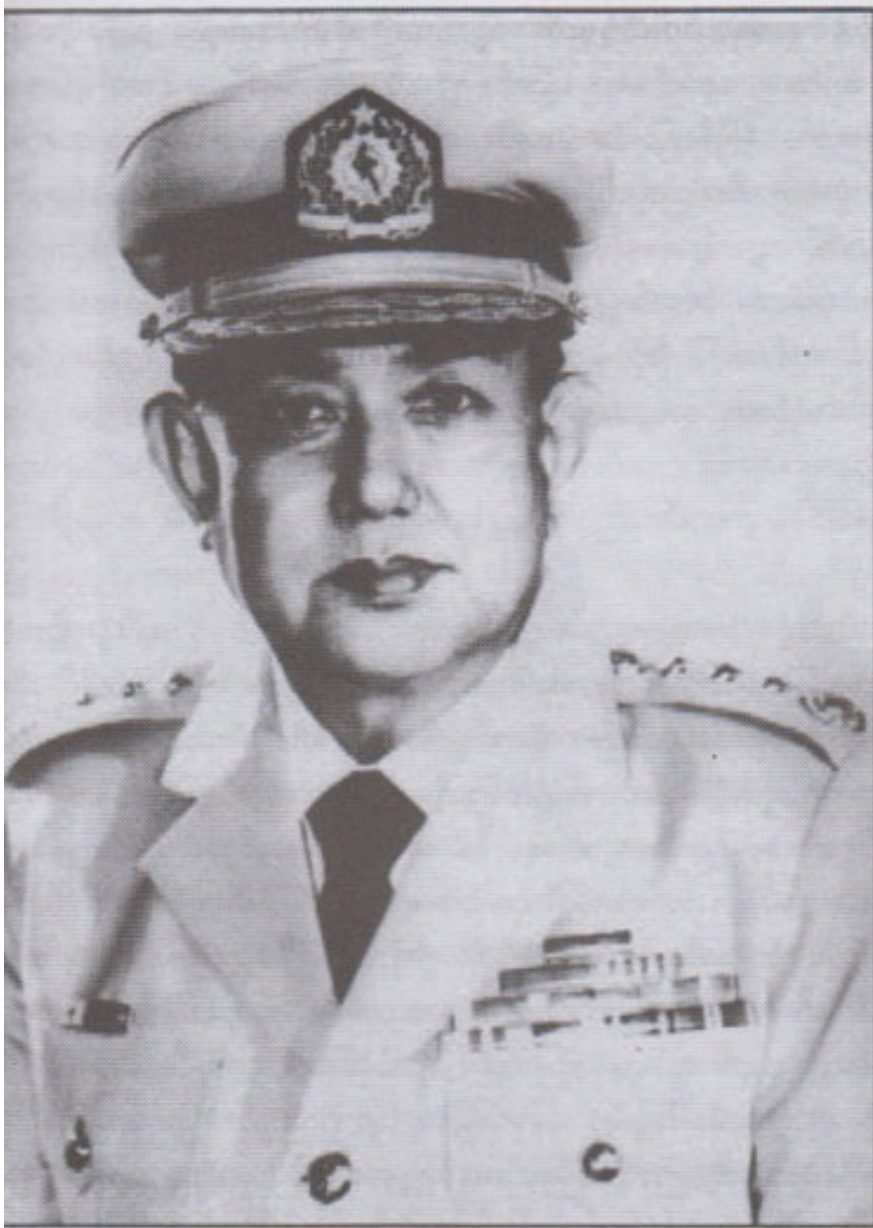
BDA တပ်မှူး မြန်မာ့တပ်မတော် ကာကွယ်ရေးဦးစီးချုပ်နှင့် ဒုတိယဝန်ကြီးချုပ် ဗိုလ်ချုပ်ကြီးသူရကျော်ထင်