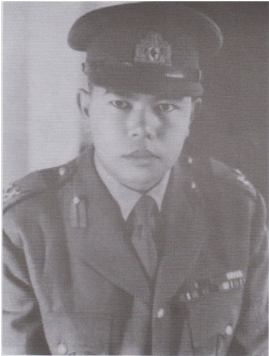
ရဲဘော်သုံးကျိပ် အဖွဲ့ဝင် မြန်မာ့တပ်မတော် စစ်တိုင်းမှူးနှင့် ဗမာပြည်ကွန်မြူနစ်ပါတီ စစ်ကော်မရှင်အဖွဲ့ဝင် ဗိုလ်မှူးချုပ်ကျော်ဇော