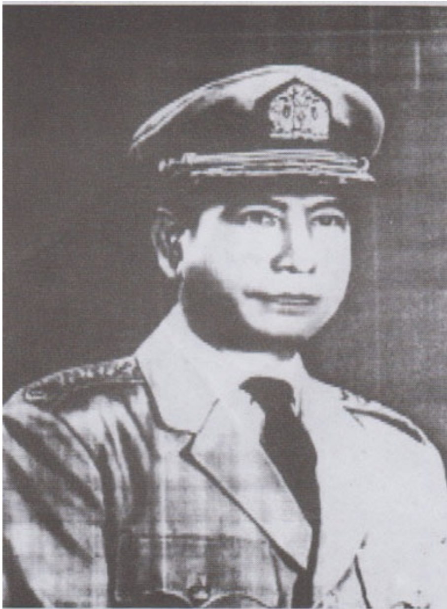
BDA ၊ PBF မြန်မာ့တပ်မတော်တပ်မှူးကြီးနှင့် နိုင်ငံတော်သမ္မတကြီး (အငြိမ်းစား) ဗိုလ်ချုပ်ကြီးစန်းယု