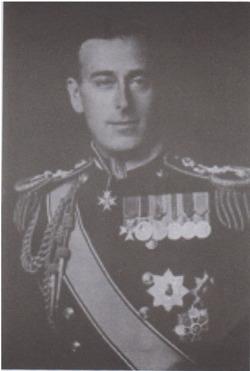
မြန်မာနိုင်ငံနှင့် ဗိုလ်ချုပ်အောင်ဆန်းအပေါ် စိတ်ကောင်းစေတနာထားသူ “မြန်မာပြည်၏ မောင့်ဘက်တန်” ဗိုလ်ချုပ်ကြီးလောဗ်လူးဝစ္စ မောင့်ဘက်တန်