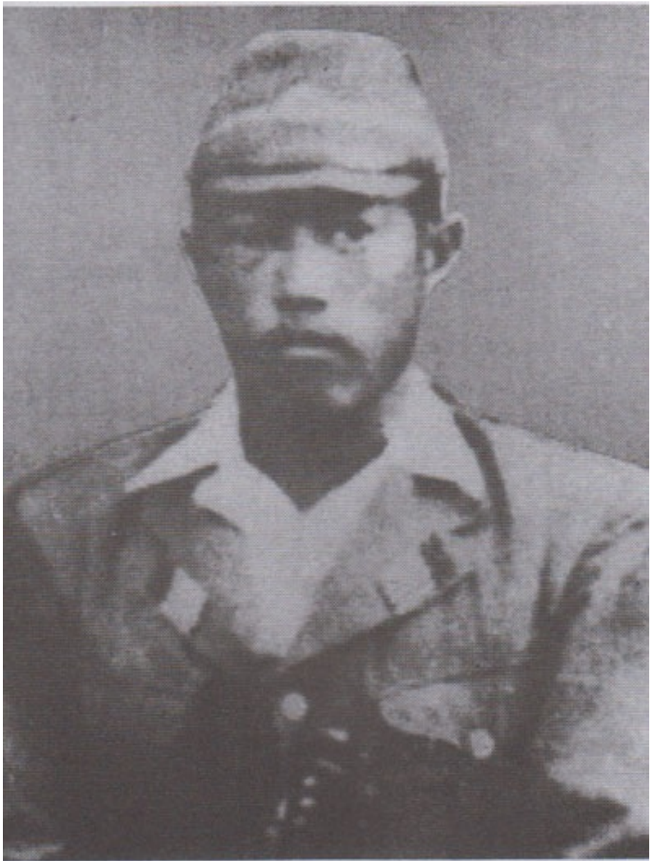
ရဲဘော်သုံးကျိပ်ဝင် မြန်မာ့တပ်မတော် တပ်မှူးကြီးနှင့် ဗမာပြည် ကွန်မြူနစ်ပါတီ တပ်မှူးကြီး ဗိုလ်ရဲထွဋ်