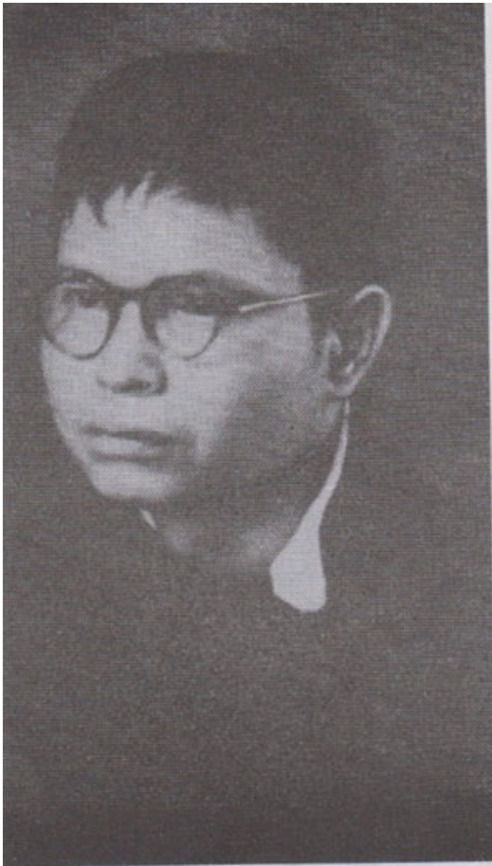
ကွန်မြူနစ်ပါတီ ဗမာပြည်၏ ခေါင်းဆောင်တစ်ဦးဖြစ်သူ သခင်စိုး (အလံနီ)