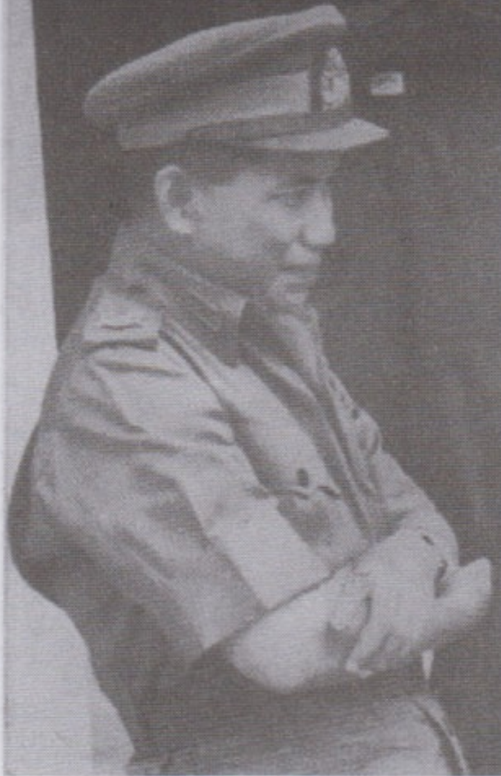
ဗိုဗမာအစည်းအရုံးသခင်၊ ဖက်ဆစ်တော်လှန်ရေးခေါင်းဆောင် မြန်မာ့တပ်မတော် တပ်မှူးကြီးနှင့် တော်လှန်ရေးကောင်စီ ဒုတိယဥက္ကဋ္ဌ ဗိုလ်မှူးချုပ်အောင်ကြီး