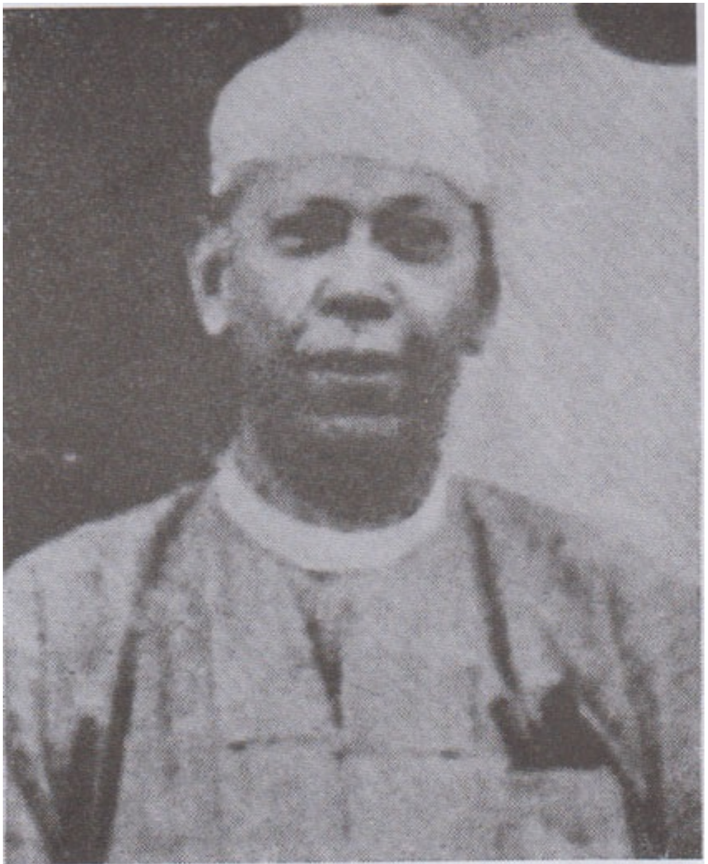
ဂျပန်ခေတ် အဝေးရောက် မြန်မာနိုင်ငံ အစိုးရ (အင်္ဂလိပ်) နန်းရင်းဝန် ဆာပေါ်ထွန်း