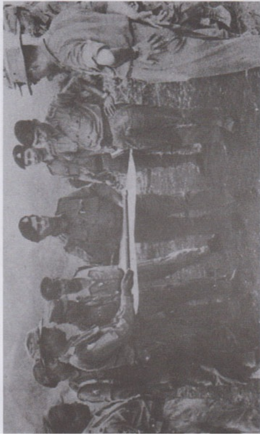
BDA တပ်ဖူးနှင့် မြန်မာ့တပ်မတော် ကာကွယ်ရေးဦးစီးချုပ် ဝိုင်းချုပ်ကြီး သူရတင်ဦး