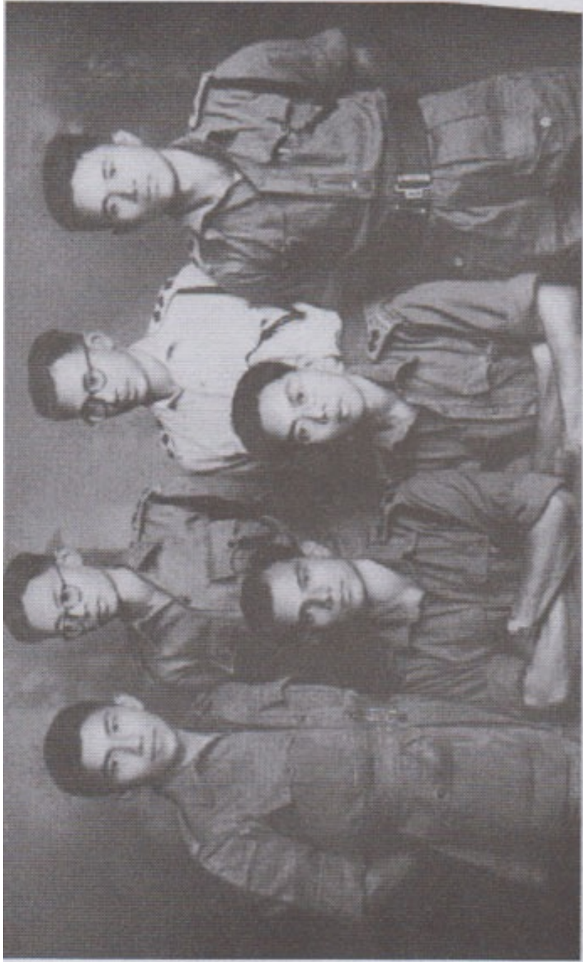
သနက (၄) မှ အရာရှိငယ်များ

ဗိုလ်ကြီးအောင်ကြီး၊ ဗိုလ်ကြီးမောင်မောင်၊ ဗိုလ်ကြီးတင်ဖေ၊ ဗိုလ်ဘစိန်၊ ဗိုလ်ကြီးကျော်ဝင်း၊ ဗိုလ်မြသောင်း