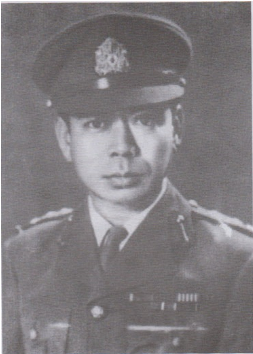
BIA၊ BDA နှင့် မြန်မာ့တပ်မတော် တပ်မှူးကြီး ဗိုလ်မှူးကြီးတင်မောင် (မြတ်ထန်)