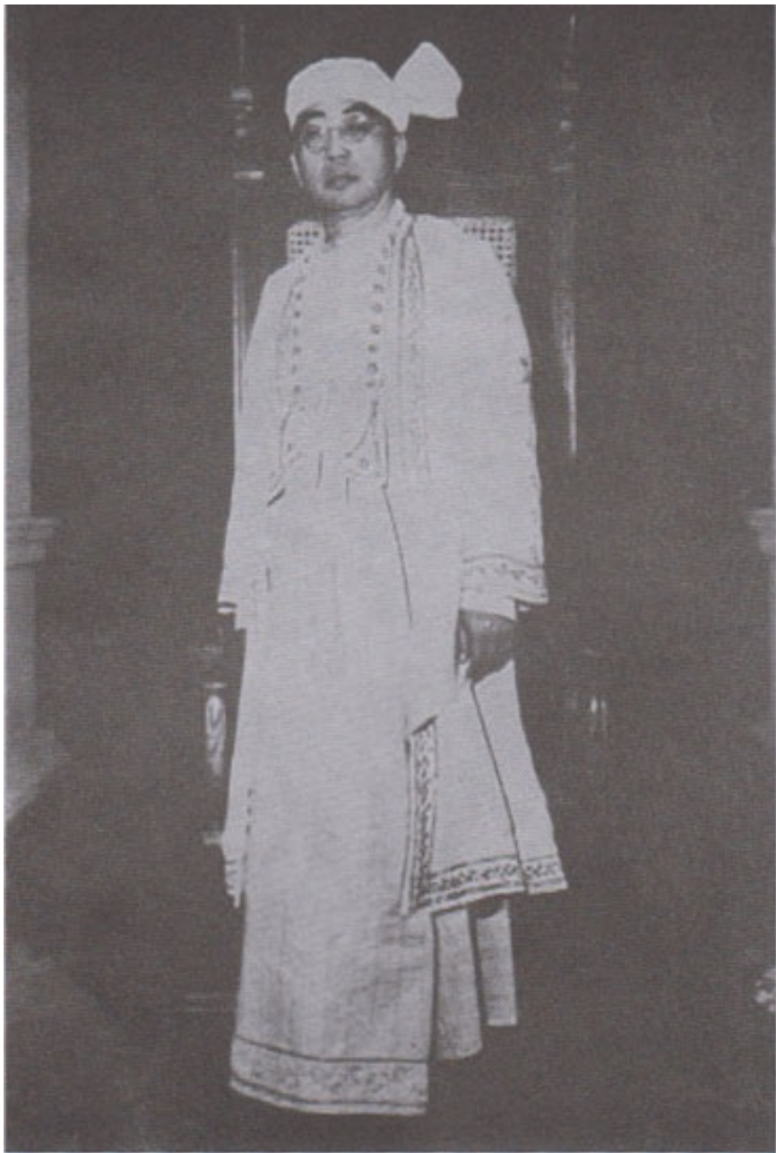
လွတ်လပ်သော ပြည်ထောင်စုမြန်မာနိုင်ငံ ပထမ သမ္မတ စပ်ရွှေသိုက် (ရှမ်းတိုင်းရင်းသား)