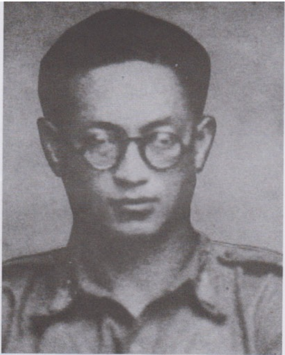
ကျောင်းသားသမဂ္ဂခေါင်းဆောင်၊ ရဲဘော်သုံးကျိပ်ဝင် မြန်မာ့တပ်မတော်တပ်မှူးကြီးနှင့် ဗမာပြည် ကွန်မြူနစ်ပါတီ စစ်ဦးစီးချုပ် ဗိုလ်လေယျ