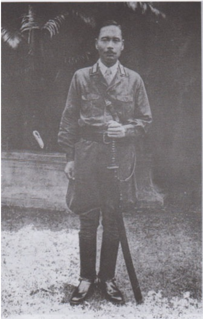
ရဲဘော်သုံးကျိပ် နှင့် BIA ကို ပြုစုပျိုးထောင်ပေးခဲ့သော ဂျပန်တပ်မတော်မှ ကာနယ်စုဌေးကီး (ဗိုလ်မှီးကြီး)