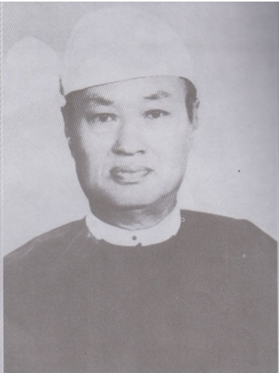
မြန်မာ့ဆိုရှယ်လစ်လမ်းစဉ်ပါတီကို တည်ထောင်ခဲ့သူ ပါတီဥက္ကဋ္ဌကြီး ဦးနေဝင်း ဗိုလ်ချုပ်ကြီး (အငြိမ်းစား)