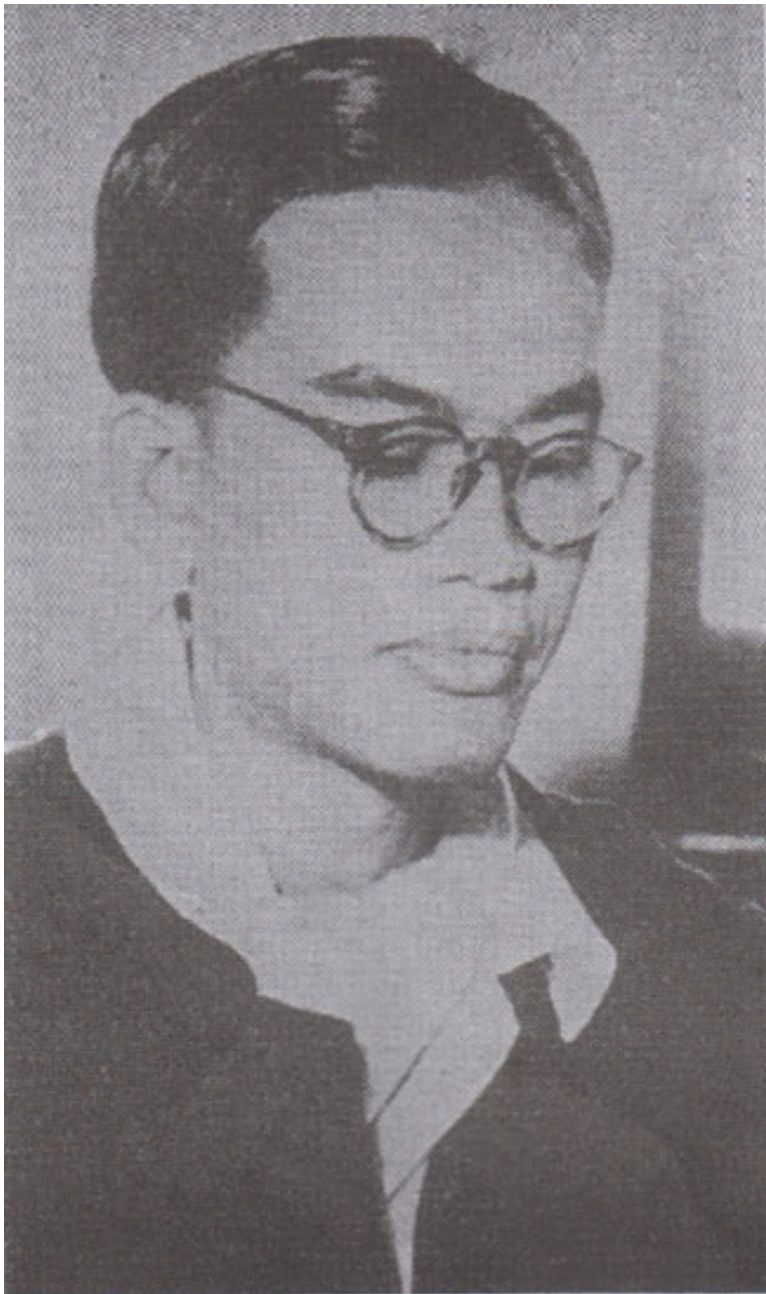
မြန်မာနိုင်ငံ၏ ကွန်မြူနစ်ပါတီခေါင်းဆောင်တစ်ဦးဖြစ်သူ သခင်သိန်းဖေ (သိန်းဖေမြင့်)